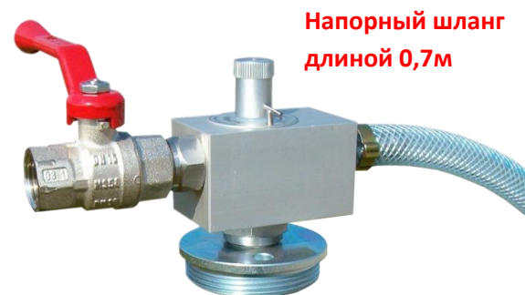
Напорный шланг длиной 0,7м